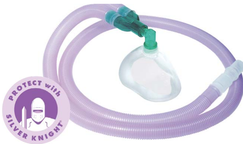
Silver Knight (Intersurgical)

Korištenjem Silver Knight sistema za disanje koji sadrži nanosrebro sprječava se mogući prijenos mikroorganizama i infekcija s bolesnika na bolesnika. Tijekom uvođenja u anesteziju, anesteziolog svojim rukama, koje su u rukavicama, prelazi preko pacijentovih usta i nosa te ih obično stavlja i u usta pacijenta. Na taj način često dolazi do kontakta sa izlučevinama iz gornjeg dišnog puta i malim količinama krvi. Tijekom početnog upravljanja dišnim putevima također je jako važno podešavati elemente za upravljanje na anesteziološkom aparatu, respiratoru i uređajima za monitoriranje i sukciju. Činjenica je da ruke anesteziologa predstavljaju glavni put prijenosa kontaminata te da je ždrijelo pacijenta najvjerojatnije izvor. Intersurgicalov asortiman proizvoda Silver Knight sistema za disanje sadrži antimikrobni aditiv koji koristi ione srebra kako bi prekinuo normalne enzimske aktivnosti mikroba i na taj način spriječio njihovo izrastanje. Točno određena razina antimikrobnog aditiva iona srebra korištena je u proizvodnji cijevi izrađene od polietilena male gustoće. Dodatak antimikrobnog aditiva iona srebra cijevima tijekom vremena uvelike smanjuje razinu živih mikroba i to sljedećih mikroorganizama: MRSA, Staphylococcus epidermis, Pseudomonas aeruginosa,