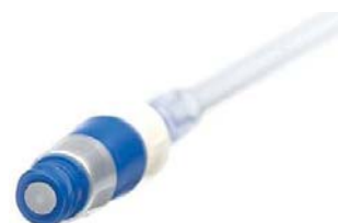
Antimikrobni MicroClave (ICU Medical)

Prateći zdravstvene potrebe tvrtka ICU Medical unaprijedila je već poznati MicroClave bezigleni pripoj na način da je u dvije od tri komponente od kojih se sastoji pripoj zaštitila nanosrebrom.